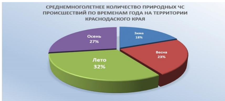
Рис. 1. Среднегодовое количество природных ЧС и происшествий по временам года на территории Краснодарского края

При этом, наиболее часто природные ЧС и происшествия связаны с пожарами (16% от всего количества ЧС и происшествий), сильным ветром (11%), паводками (10%), комплексом неблагоприятных метеорологических явлений (9%) (Рис 2).